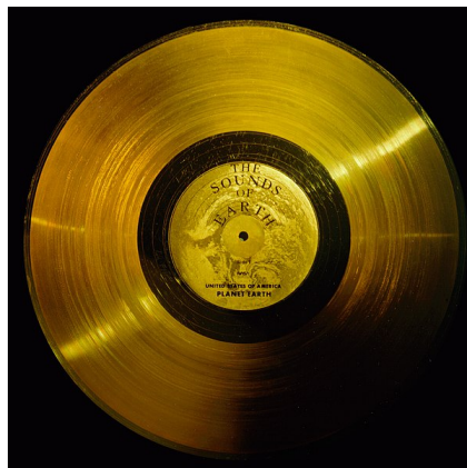
Disco de oro incluido en las sondas Voyager .

En los siguientes enlaces pueden acceder al contenido que porta el disco de oro de la Voyager .